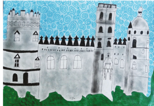
Paweł Najda ZAMEK KAZIMIERZOWSKI