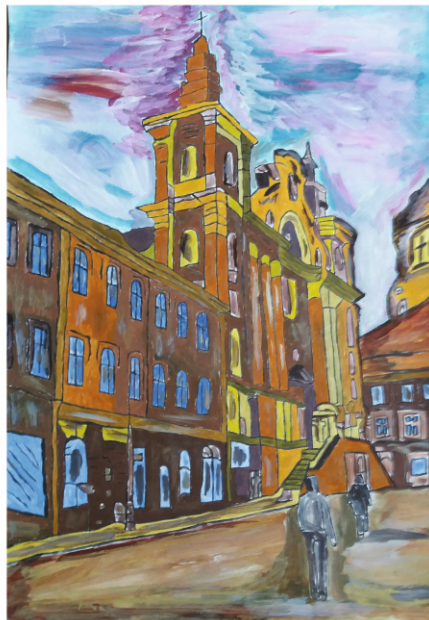
I NAGRODA KATEGORIA: MALARSTWO