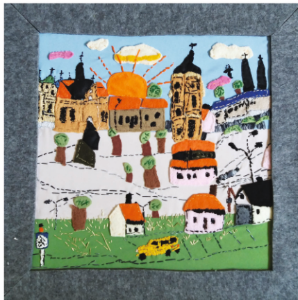
Piotr Sołomczak RYNEK PRZEMYSKI