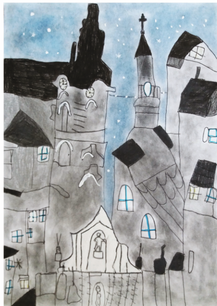
Paweł Wróbel W ŚWIETLE GWIAZD