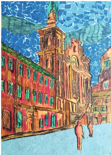
II NAGRODA KATEGORIA: APLIKACJA/COLLAGÉ