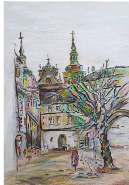
I NAGRODA KATEGORIA: MALARSTWO