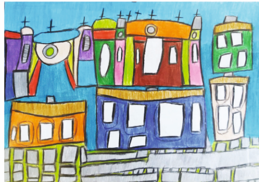
Elżbieta Wiącek KOŚCIOŁY PRZEMYSKIE