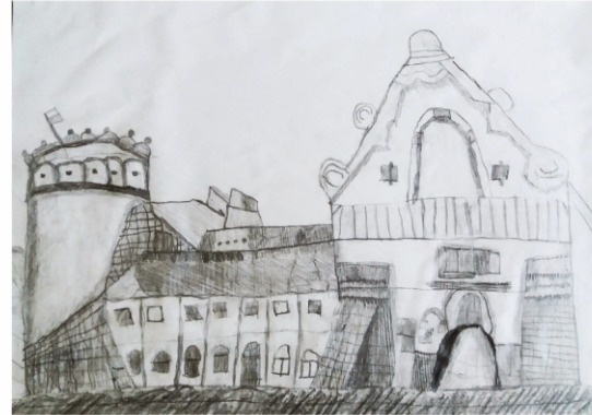
WYRÓŻNIENIE / KATEGORIA: RYSUNEK Anna Włoch ZABYTKOWY ZAMEK