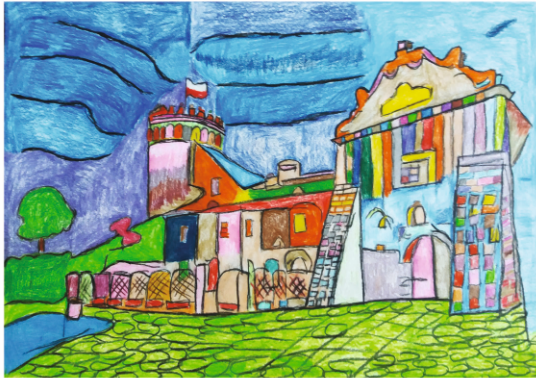
III NAGRODA / KATEGORIA: MALARSTWO Katarzyna Dudziak ZAMEK KAZIMIERZOWSKI