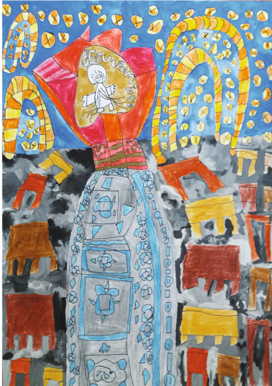
Piotr Pasierbski WNĘTRZE KOŚCIOŁA SALEZJANÓW