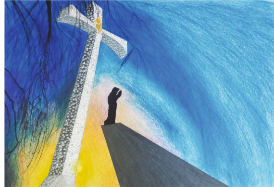
WYRÓŻNIENIE / KATEGORIA: MALARSTWO Jacek Hrynkiewicz PRZEMYSKI KRZYŻ