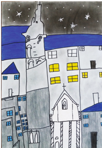
Dominika Droń PRZEMYŚL NOCĄ