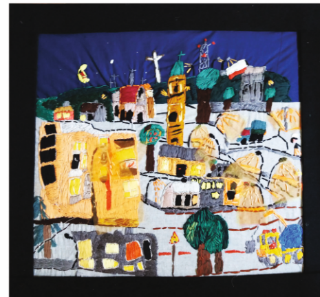
Piotr Sołomczak PRZEMYSŁ NOCĄ. WIDOK Z OSIEDLA RYCERSKIEGO