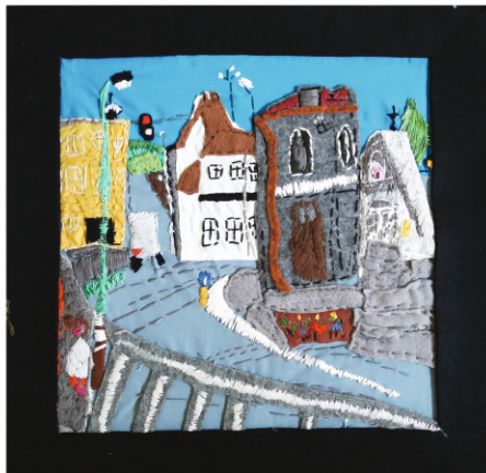
Piotr Sołomczak PLAC KONSTYTUCJI 3 MAJA